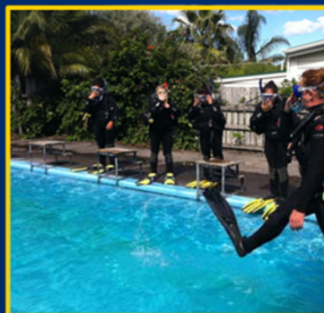
Respect for Learning