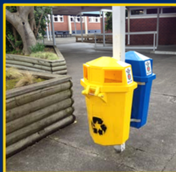
Respect for Environment