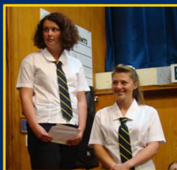
Respect for Self