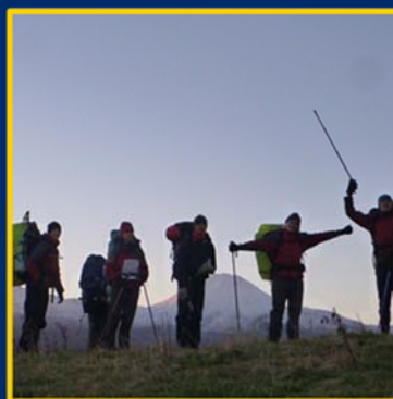
Respect for Others